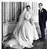
William & Kate: ancora nozze reali in attesa del 29 aprile