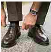
Cerchi la miglior qualità di scarpe senza spendere una follia? Scopri Velasca (Velasca)