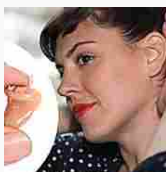
Nuovi apparecchi acustici invisibili per gli over 50 (Clinic Compare)