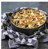
Guida alle tortiere: come preparare dolci gustosi con gli strumenti ideali (Cucina Atelier)